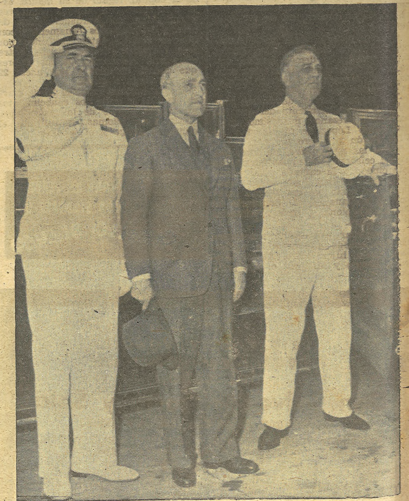
LA VISITA DEL PRESIDENTE DEL PERU AL PRESIDENTE ROOSEVELT