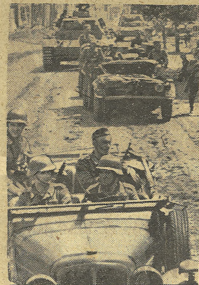
La ofensiva alemana en Rusia.—Fuerzas blindadas y motorizadas alemanas en las calles de Voronech.

Se cree que el atentado fue obra de unos exaltados, pues la emisora fue inscrita recientemente en las "listas negras" norteamericanas.—Efe.