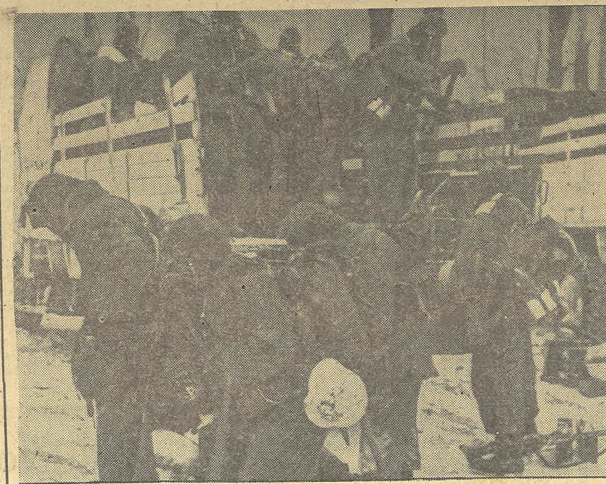
Un batallón de granaderos blindados alemanes llega a una aldea rusa en camiones; después marcharán a las líneas de vanguardia a pie.