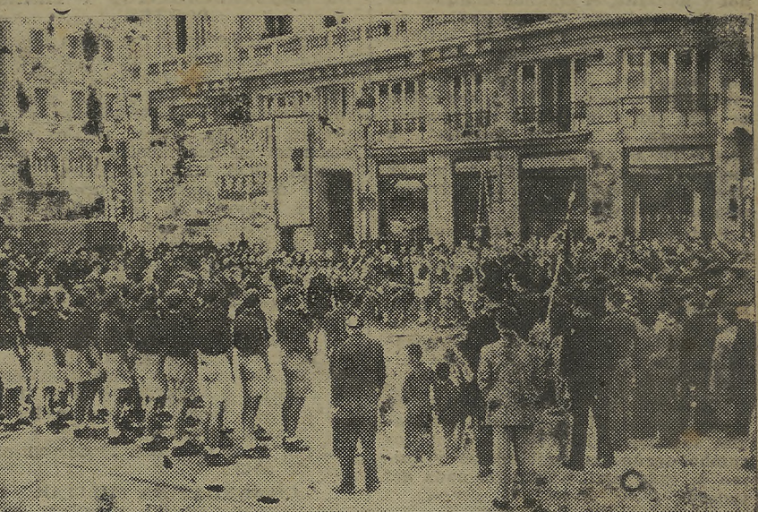
Madrid.—Los camaradas del Frente de Juventudes que han de participar en la magna concentración que el día 1 presidirá el Caudillo, desfilan por las calles madrileñas. (Foto Cifra).

Tuvo lugar ayer en la Plaza de Toros de Madrid atestada de cadetes, flechas, flechas navales y flechas azules