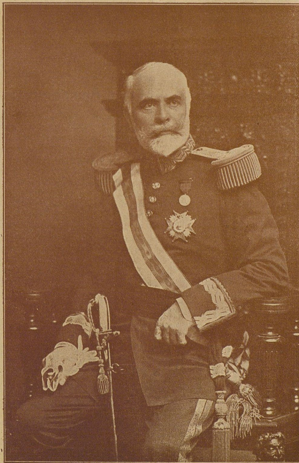
El Excmo. Sr. Marqués de Cabra a quien acaban de tributar un homenaje sus paisanos y amigos.