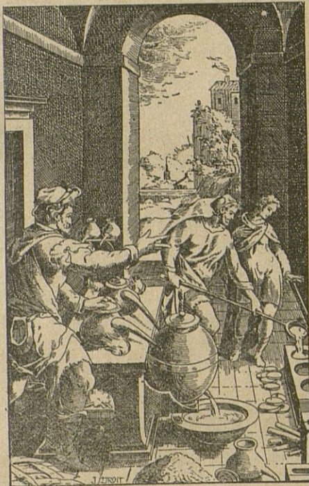
LABORATORIO DE QUÍMICA