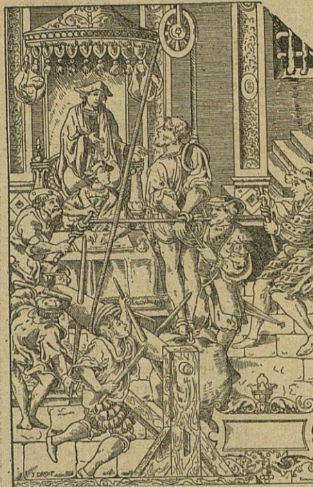
EL ALQUIMISTA EN EL TORMENTO

Tenemos a la vista un grabado en madera del museo germánico de Nuremberg, mostrándonos al alquimista bajo las bóvedas ojivales y oscuras de una vieja morada gótica. Tenemos noticia de que allí se iniciaron los primeros ensayos del método analítico. Es curioso considerar a aquellos hombres que cuando más dispondrían de