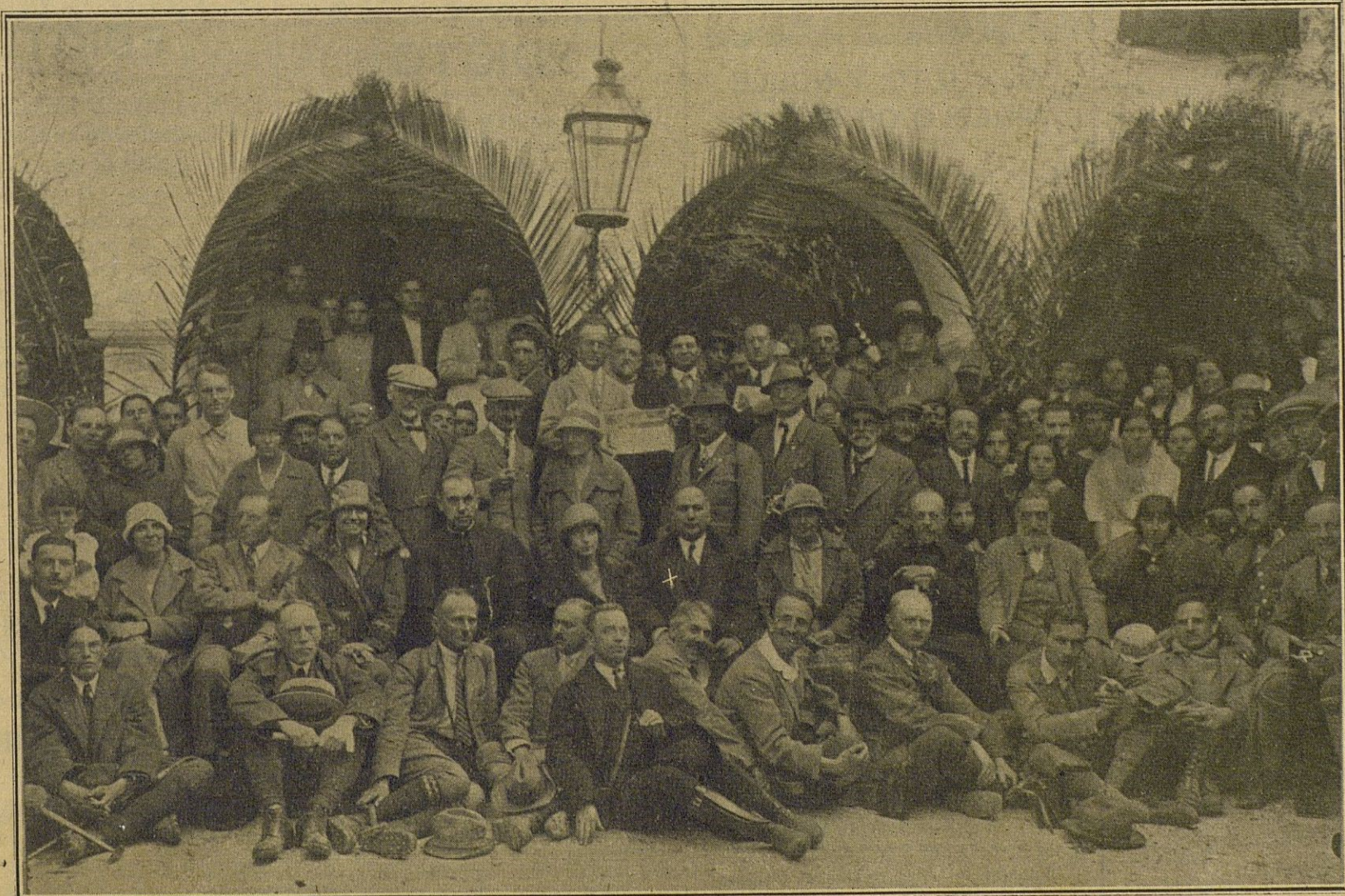
El Alcalde de Cabra, (x) y otras distinguidas personas, rodeadas de los excursionistas del Congreso Geológico y de gran número de romeros, en el patio del Santuario de Ntra. Patrona.

Automóviles FIA Duración. Economía. Comodidad.