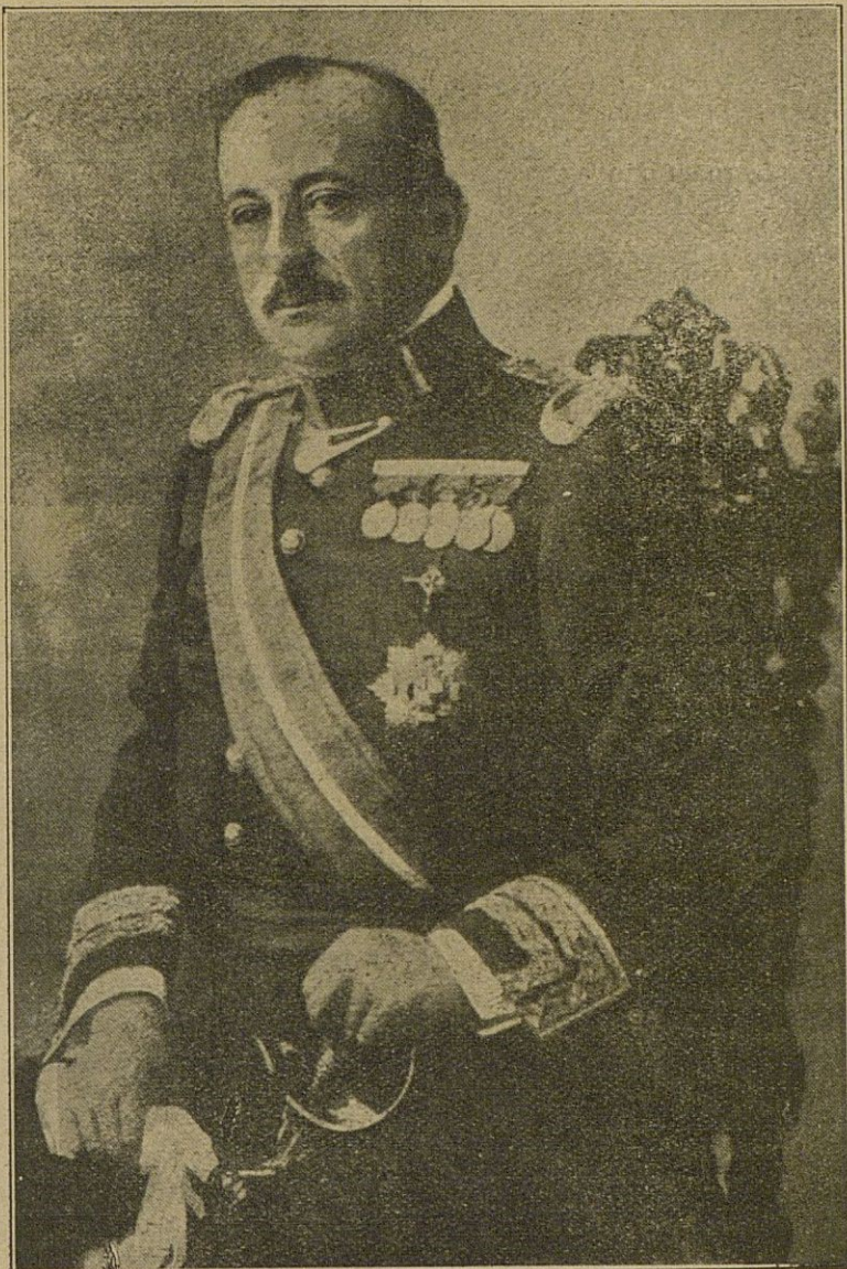
Excmo. Sr. D. Miguel Primo de Rivera, Marqués de Estella

Fué uno de los puntos del programa conque en tan feliz hora para España, vino a regirla el Directorio Militar, que como el actual Gobierno presidió el Marqués de Estella, solucionar el problema de Ma-