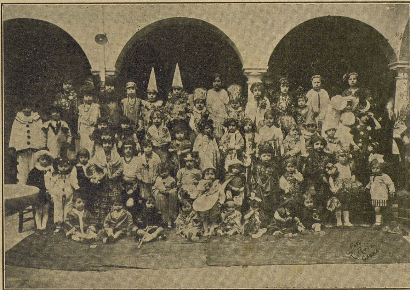
Niños de ambos sexos que asistieron a la fiesta infantil celebrada en el Círculo de la Amistad

Se... la... desde S. Juan... 12.º pi... de la ca... la calle... Teniente... razón en la... Imprenta de es... ario.