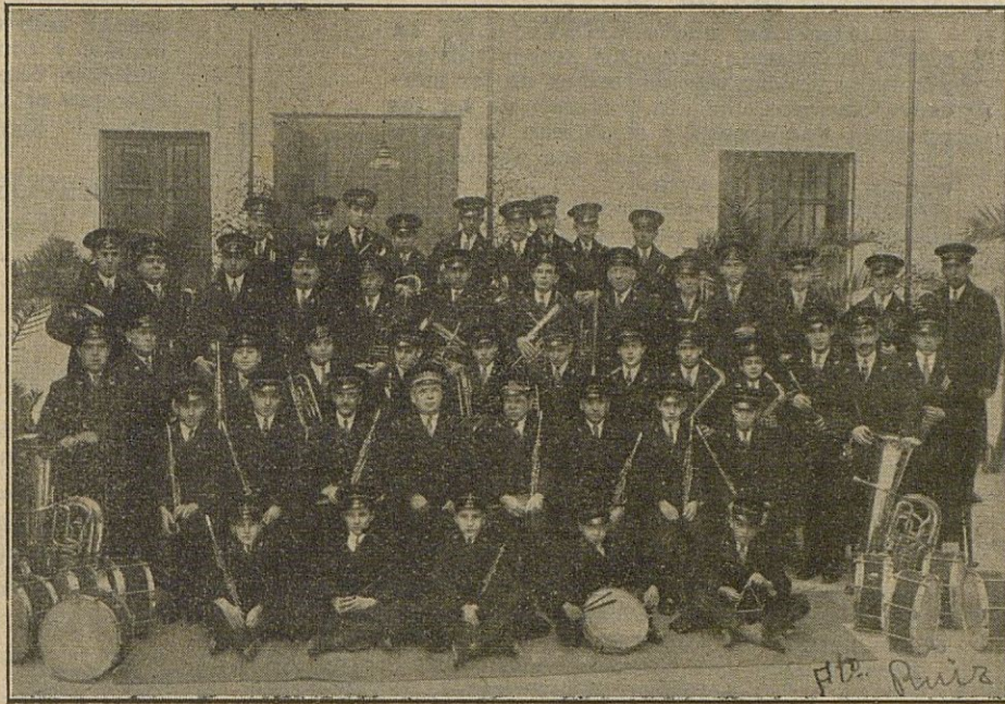
Nuestra Banda Municipal, con los elegantes uniformes que recientemente ha estrenado.

El viernes por la mañana se celebró en la antigua Plaza Vieja el paso de Abrahan y el prendimiento de Jesús. Miles de personas, entre las que descollaba el elemento femenino, contemplaron desde balcones, azoteas y el suelo las tradicionales