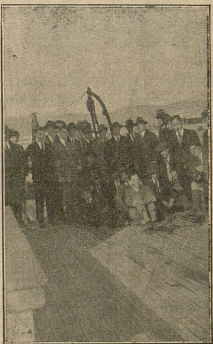
En el vapor.

He aquí un pueblo que al fin despierta. El contrabando era el opio enervador de las energías de Algeciras. ¿Quién propuso levantar una estatua en honor al «no-contrabandista desconocido» (!!)?