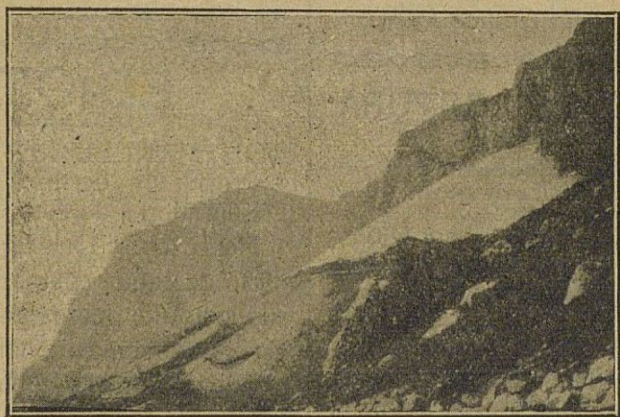
Cantil oriental del Peñón.—Cisterna.

Catedrático del Instituto de Aguilar y Eslava