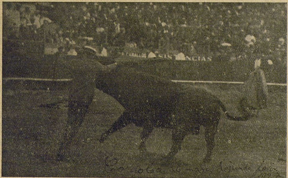
...En otra ocasión me tiré en la segunda corrida de feria de Córdoba...

—Como los de aquí no se preparen bien—me dice un viejo aficionado cordobés—vais a ser los amos . Por lo pronto las dos corridas contratadas no hay quien las iguale. El domingo pasado me