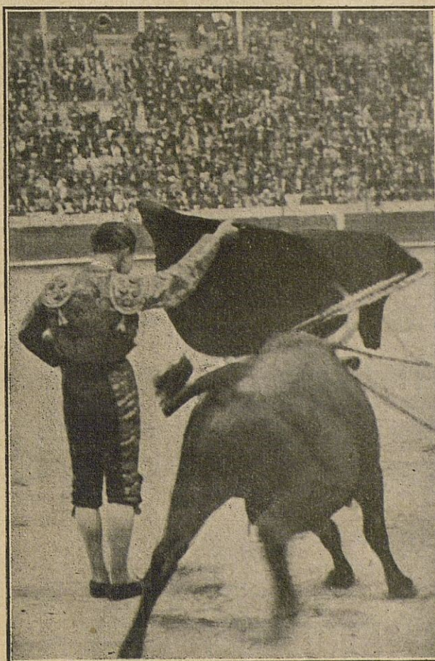
A mí, acompañándome bien el toro...