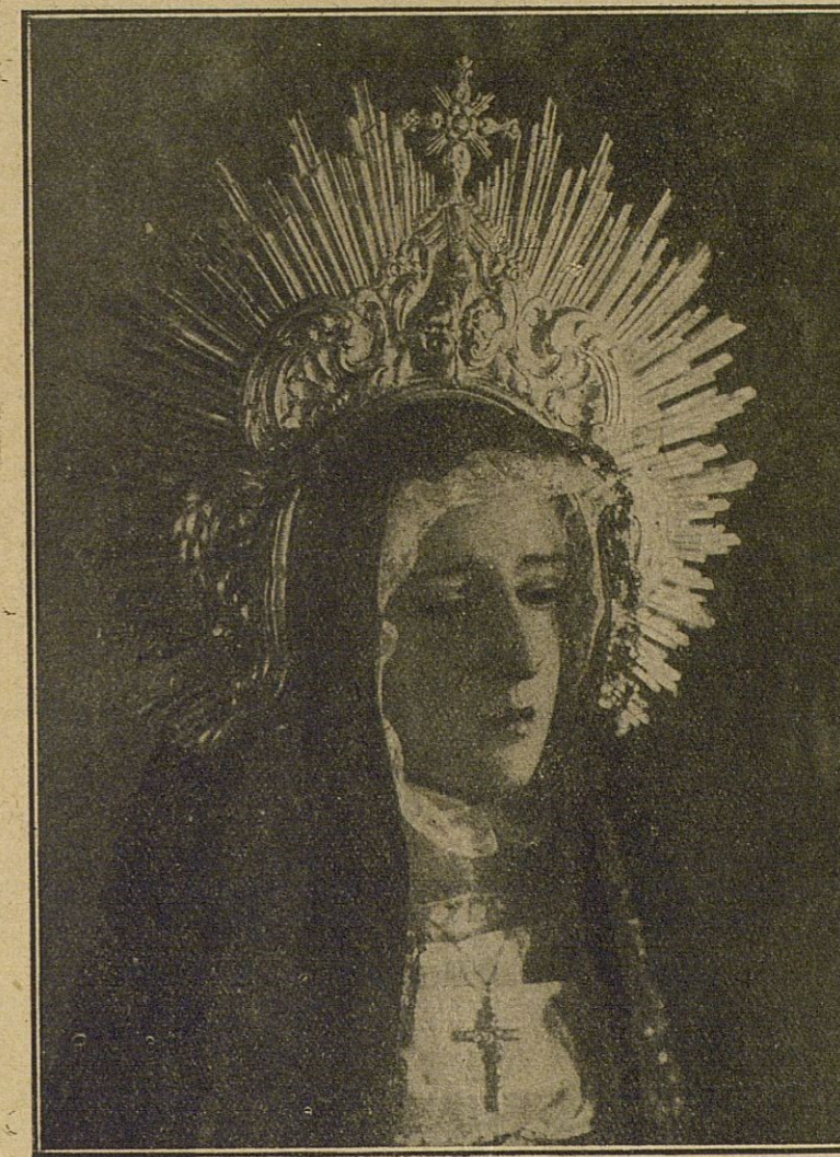
«Aquella imagen es una obra maestra del arte cristiano.....»