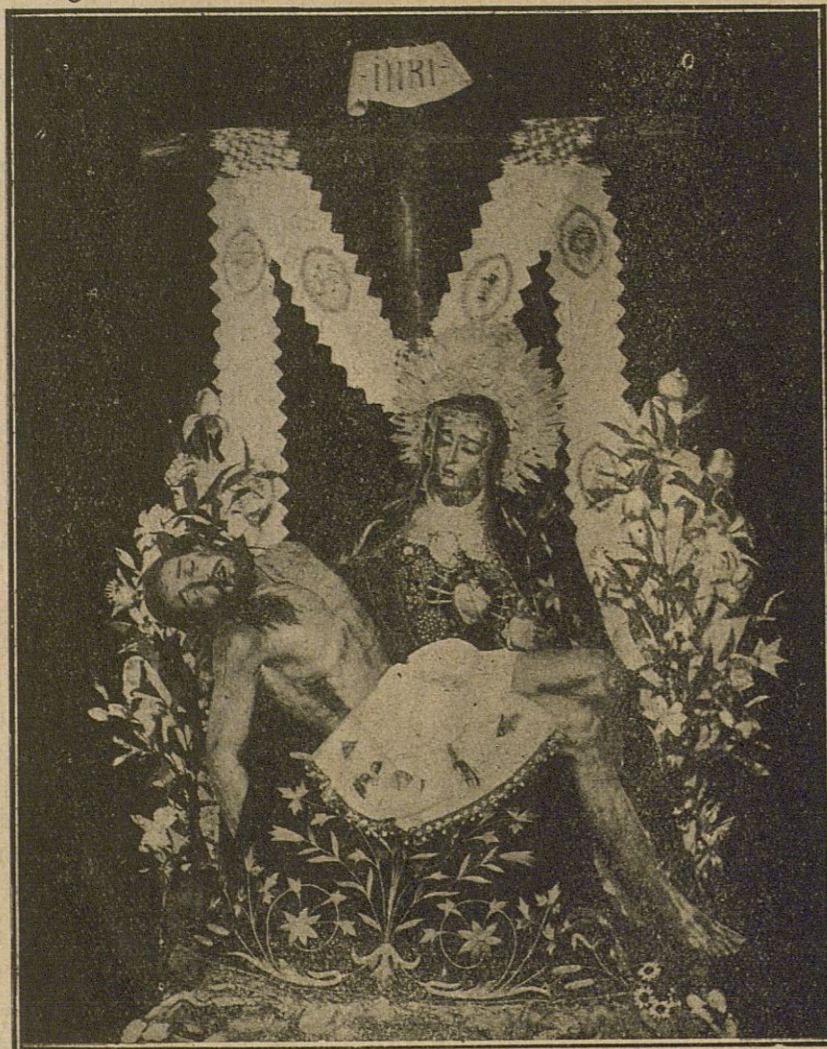
«Yo que las he visto en otra población, conservo de ellas el más grato recuerdo.....»

Como los profetas hicieron vida áspera y penitente, y no se cuidaron mucho del primor y de la elegancia en el vestir, se llaman los ensabanados , porque sus túnicas y mantos están hechos con sábanas. Y por el contrario, los monarcas y grandes señores se engalanan con todo el lujo que pueden, llevando por túnicas los mejores vestidos de sus mujeres o de sus novias, y por mantos las colchas más ricas de las camas, por lo cual se llaman los encolchados .