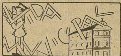
Se prorroga el plazo para el pago de impuestos municipales

Pero la gayomba... ¿dónde está la Sociedad protectora de animales y plantas? De E.