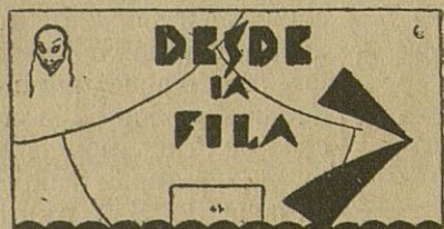
La Danza de la vida

Estamos disfrutando de unos excelentes programas cinematográficos, tanto mudos como sonoros. Gracias a la competencia del cine sonoro llegan ahora a los pueblos las mejores películas mudas de alta cotización, y por el poco repertorio sonoro, las últimas ediciones llegan aquí con muy pocos días de retraso, tal es «La Pura Verdad», estrenada en Madrid, en el Astoria, a mediados del mes pasado.