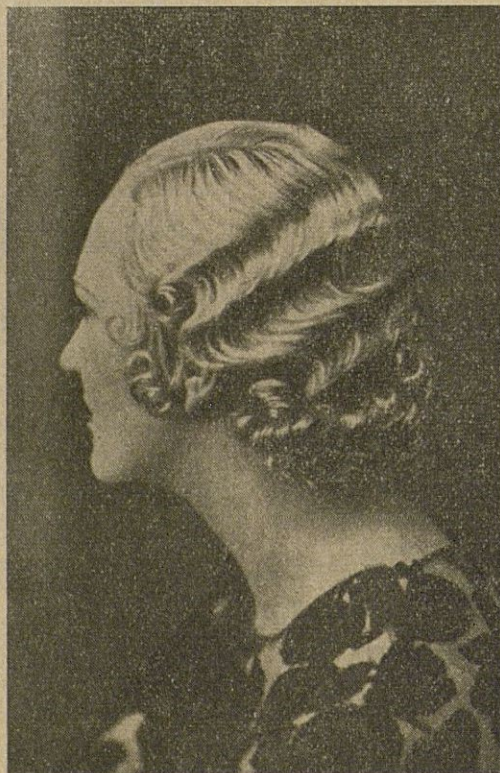
Permanente hecha con el sistema SOLRIZA

para onda ancha y puntas rizadas. GRANMODA