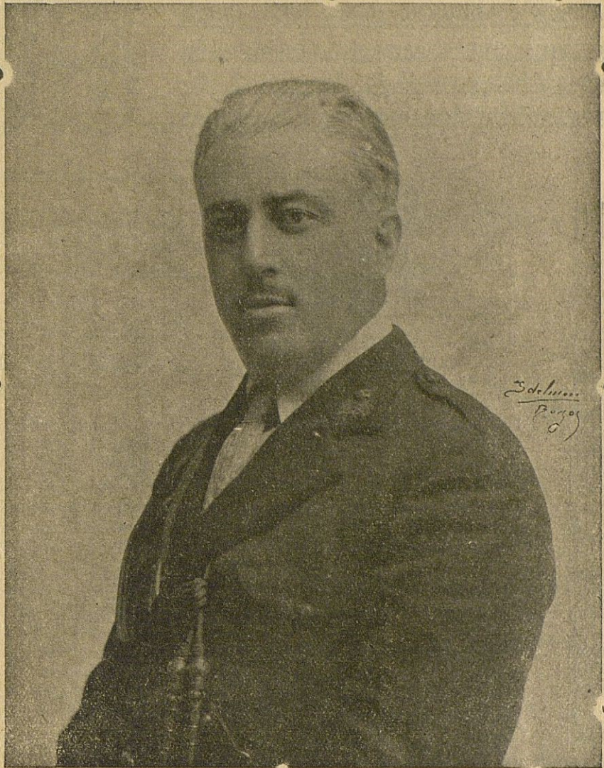
D. JUAN YAGÜE

Tercio invencible van unidas a un nombre que es su director, su guía, su maestro, la mente que concibe el plan, la espada que brilla en la vanguardia en el momento de la ejecución, el militar modelo en quien se armonizan felizmente la pericia del jefe y la intrepidez del soldado: Juan Yagüe.