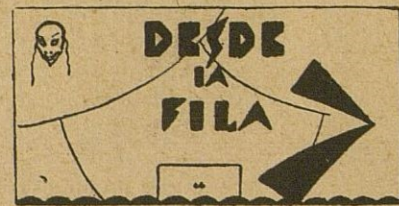
Revista de películas

Comenzó la semana con una comedia del tipo clásicamente americano, lo que equivale a decir que «La rubia del Folies» que tal era el nombre del film, tenía poco interés y mucha conversación. Para esta película se han reunido actores pero por el mismo asunto, sin lucimiento posible. Robert Montgomery está a tono con la comedia y Billie Dove, muy guapa.