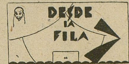
Revista de Películas

Los «Presentes» resonaron con intensidad y emoción en el silencio in-