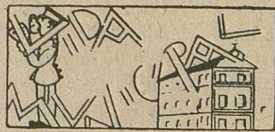
Obras públicas.--Pavimentación y saneamiento :-:

Brillantemente ha transcurrido la novena en honor del Sagrado Corazón de Jesús, en la Parroquia de la Asunción y Angeles.-Ayer comenzó en la Iglesia de la Aurora, la novena a las Animas Benditas.-Las obras públicas municipales.-Están al cobro las cédulas personales.-Otras informaciones y noticias.