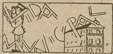
Para el Hospital de tuberculosos en Córdoba