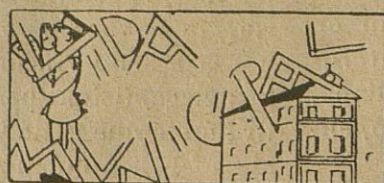
Las obras del Grupo Escolar del Paseo

En la fiesta de la Banderita celebrada el Día de San Juan se puso de manifiesto el patriotismo y desprendimiento del pueblo egabrense, obteniendo una buena recaudación.--Postularon bellas señoritas.--Otras informaciones y noticias egabrenses de interés general 'o.