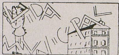
Ya se están entregando las cantidades para la reconstrucción de las casas destruidas por el bombardeo marxista.

Anoche hizo su triunfal entrada en la Ciudad la Imagen de nuestra Patrona María Santísima de la Sierra.—Fue un acto magnífico en el que todo un pueblo enfervorizado, aclamó hasta enronquecer a su Madre idolatrada, a la Paloma Blanca, a la Remediadora de todas sus penas