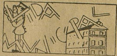
El alumbrado de la calle Barahona de Soto

Ya luce la calle Barahona de Soto la nueva y espléndida iluminación, como corresponde al centro de la ciudad.-Se estrenó en el Teatro Principal, la gran película "Piloto de Pruebas" que obtuvo un gran éxito.-El próximo viernes, 23 del actual, la agrupación "Pepita Jiménez" estrenará "La Marquesona", un gracioso sainete