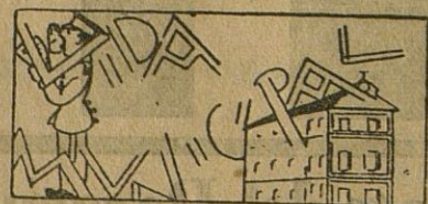
El Alcalde, a Madrid

El domingo por la tarde, se celebra la primera procesión con la traída a la Parroquia de Santo Domingo, del sepulcro del monte Calvario.-El sepulcro de plata está ya en San Juan de Dios, para los cultos que comienzan el sábado próximo.-Los demás cultos siguen celebrándose con esplendor.