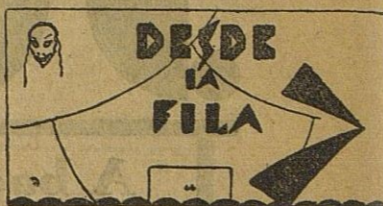
Un nuevo triunfo de la agrupación teatral "Pepita Jiménez."

Dolores Gaspar Lara, por promover escándalo en la vía pública, 5.