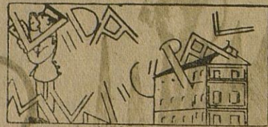
Una nota de la Alcaldía: para el mayor orden y brillantez de las procesiones.

Normas de la Alcaldía que han de observarse durante las procesiones, para el mayor lucimiento de los desfiles.—Regreso del Alcalde.—Suministro de azúcar y café al vecindario.—La agrupación artística "Pepita Jiménez", calza a los huérfanos de los comedores de Santo Domingo