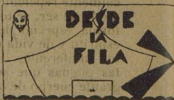
Revista de películas