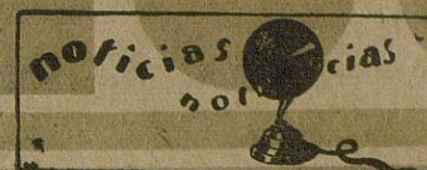
Toma de dichos

Delegación de abastos.-Próximo suministro de azúcar, arroz, bacalao, habichuelas y garbanzos.-Vida religiosa.-Novena a San Francisco y a San José.-Resultan muy brillantes los conciertos de la Banda Municipal, en el hermoso Paseo Alcántara-Romero, repleto de rosales.-Otras informaciones y noticias.