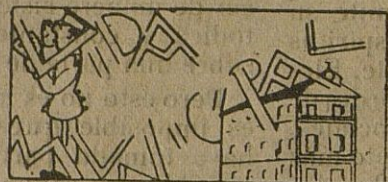
Delegación de Abastos

Nueva oposición para cubrir dos plazas vacantes en las oficinas municipales.-Los ejercicios serán el 29 de julio próximo.-Al cobro el primer trimestre del Repartimiento General sobre utilidades.-También se cobra el primer semestre del impuesto sobre canales y canalones