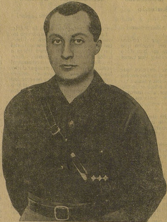
✚ José Antonio Primo de Rivera: ¡PRESENTE! 20 de Noviembre de 1936

qué escaleras y qué alfombras y qué automóviles a la puerta, cuánta gente con enchufes magníficos. Ahora, que ni las escaleras, ni las alfombras, ni los automóviles, ni las prebendas de los enchufados sirven para que la tierra produzca más ni para que vosotros tengáis menos hambre.