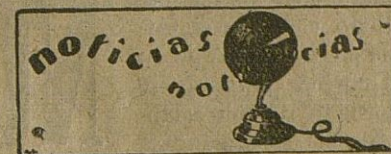
Los Previsores del Porvenir