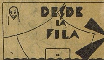
Revista de películas

Sigue buena la temporada de cine. Se ven interesantes y modernos trenos. Los más destacados de la semana anterior, fueron «El pequeño hombrecito» nueva creación del pequeño «as» Jackie Cooper, desahogada en el ambiente de una acogedora y un hospicio, a través de las trigas humanas, el proceso de su madre envuelta y castigada en una farsa acusación, que le aparta de sus pañeros en milicia, y la vuelta a la madre, libre de culpa, que hace traspasar al pequeño en un partido de fútbol, y la vuelta a la academia, entre que asciende por su valor y entra en las horas amargas. Muy buena interpretación.