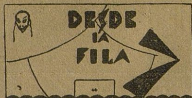
Revista de películas

La Cofradía de Ntra. Sra. de los Dolores, solemnizó la inauguración del nuevo camarín de su Santa Titular, con una solemne función en la que el Centro Filarmónico, cantó la célebre misa del Abate Perosi.—Siguen con extraordinaria concurrencia los cultos propios de estos días de Cuaresma.