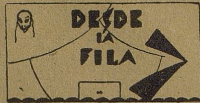
Revista de películas

Reparada la avería de la linterna del aparato de proyección, ya resulta agradable nuevamente ver el cine. El domingo se proyectó en estreno un moderno film «Nacida para la Danza» de ambiente musical y de revista que tan admirablemente dominan los americanos. Aquí el asunto es lo de menos, porque sólo sirve para enlazar unos números musicales, dinámicos y divertidos a través de unos cuadros de revista, montados con lujo y exquisito alarde de buen gusto. Una dirección cuidada y unos intérpretes de primera categoría dan a la cinta el ritmo y la gracia para hacer pasar un agradable rato.