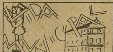
El pago del reparto, ampliado hasta el día 20.