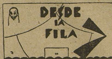
Homenaje a Muñoz Seca por la Agrupación «Pepita Jiménez»