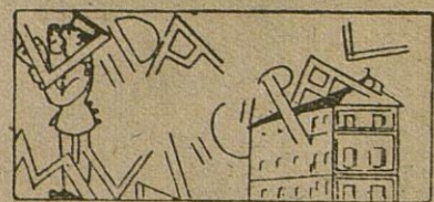
Al cobro las cédulas personales para el actual ejercicio.

También en el Ayuntamiento se recaudan fondos para el Aguinaldo de la División Azul, por plazo breve.-La Agrupación "Pepita Jiménez" va a rendir homenaje a la memoria de Muñoz Seca, poniendo en escena "El conflicto de Mercedes", una de las comedias más bien trazadas por el malogrado autor teatral