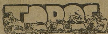
La corrida del Sábado de Gloria

Ya hemos visto circular los programas de la novillada con que se inaugura la temporada taurina en Cabra el próximo Sábado de Gloria.