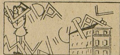
El concurso de casas y fachadas en el barrio de la Soledad.

Recordamos a los contribuyentes: que hasta el día 5 del venidero mes de Junio se paga el segundo trimestre del Repartimiento, y hasta el 10 del mismo mes el segundo trimestre también de las contribuciones al Estado.-Ya están en Cabra los cuatro pararrayos que se van a instalar en el Santuario de Nuestra Patrona.-Otras va- - - - rias noticias. - - -