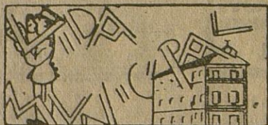
Al cobro el 4.º trimestre del Repartimiento

La cultural sociedad Centro Filarmónico Egabrense ha abierto clases gratuitas de piano, solfeo, violín, guitarra, bandurria, violoncello y canto para los hijos de los socios y protectores.-Se propone también celebrar este año con extraordinaria brillantez la fiesta de la Patrona del divino arte la mártir Santa - Cecilia -