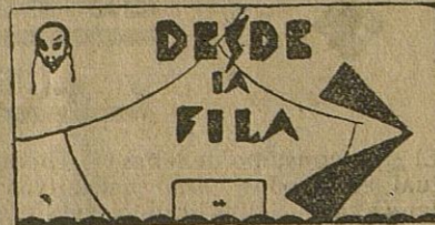
Revista de la semana