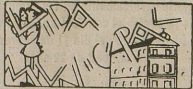
El Repartimiento de Utilidades, expuesto al público.

Recordamos a los contribuyentes que hoy miércoles es el último día que se paga en período voluntario el primer trimestre de las contribuciones al Estado.--Las listas del Repartimiento municipal a disposición del público para su examen al efecto de reclamaciones.--63.487'82 pesetas fueron repartidas hace unos días entre 311 ancianos acogidos al Subsidio a la Vejez, en Cabra o