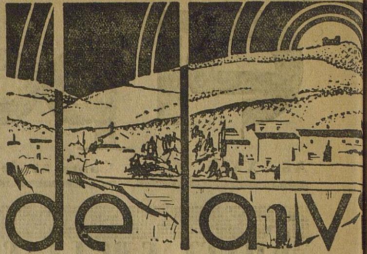
De las pasadas Fiestas

Vida Municipal: Un edicto interesante para los propietarios de fincas rústicas. Los premios de los Concursos de patios de los barrios de la Soledad y de la Placeta.--El próximo Domingo se celebrarán en la Ermita de La Esperanza las tradicionales fiestas en honor de la Santísima Virgen del Rosario.--Otra novena en honor de nuestra Excelsa Madre y Patrona o o o o o