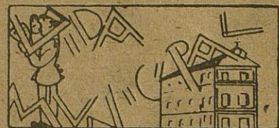
Concurso para proveer las plazas de los surtidores de gasolina.

Vida Municipal: Está expuesto al público el padrón de edificios sujetos al pago de los derechos establecidos sobre servicios de alcantarillado.—Salen a concurso las Agencias de Gasolina de esta localidad.—20.789 habitantes tiene Cabra según el último censo facilitado por la Dirección General de Estadística.—Otras noticias e informaciones.