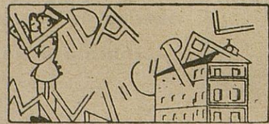
Las nuevas cartillas de racionamiento

Los tradicionales y solemnes cultos de Cuaresma: Esta noche comienza en la Parroquia de Ntra. Sra. de la Asunción y Angeles el quinario a Ntro. P. Jesús de la Humildad y Prisión. —De la próxima Semana Santa Egabrense: Las mejores que presentarán las Cofradías y las nuevas procesiones que desfilarán en la madrugada del Jueves y mañana del Domingo de Pascua. o o o