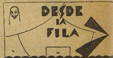
CINE.—En la Plaza de Toros