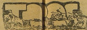
La nocturna de la Virgen de Agosto

Tal es en conjunto el juicio que nos merece esta superproducción de la Ufa, estrenada el lunes en la Plaza de Toros.