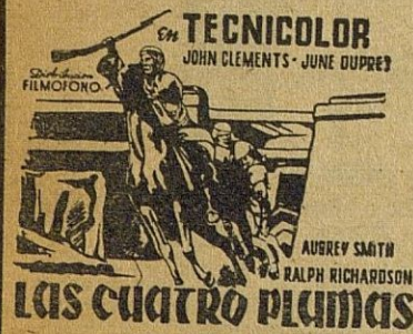
En TECNICOLOR JOHN CLEMENTS - JUNE DUPREZ AUBREY SMITH - RALPH RICHARDSON LAS CUATRO PLUMAS

La empresa de este Local advierte al público, que por la escasez de copias en technicolor, solo se proyectará esta película los días 23 y 24, y para que todos puedan admirarla, se darán dos funciones diarias a las 9'30 y 11'45.