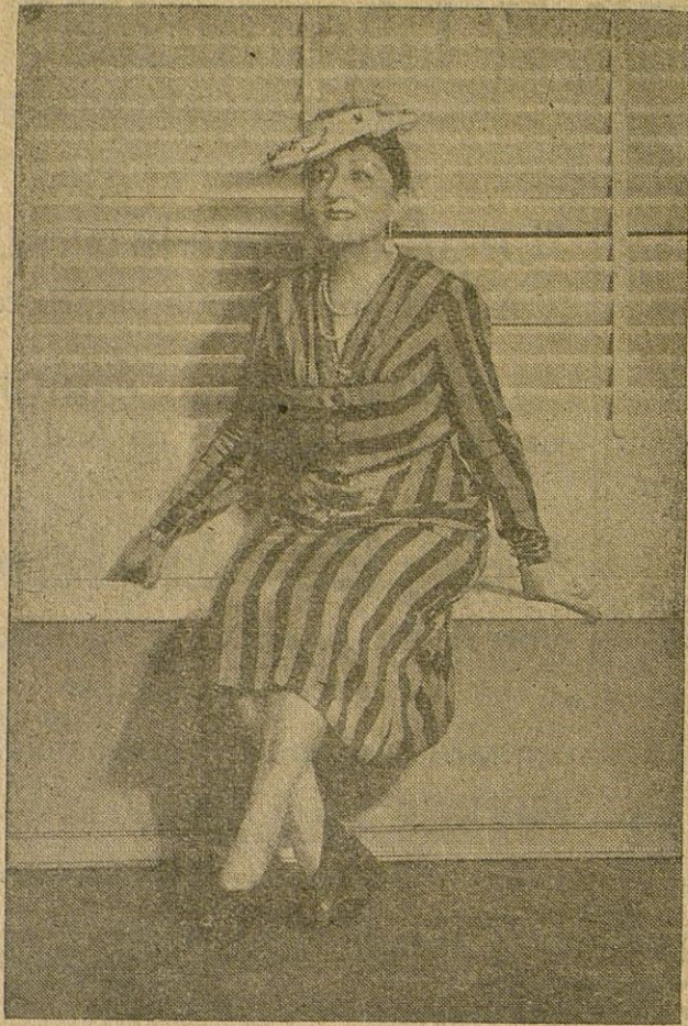
La excelente primera actriz Josefina Otero, que al frente de su bien conjuntada compañía de comedias, ha iniciado, con grandioso éxito, una brillante temporada en el Teatro Principal.