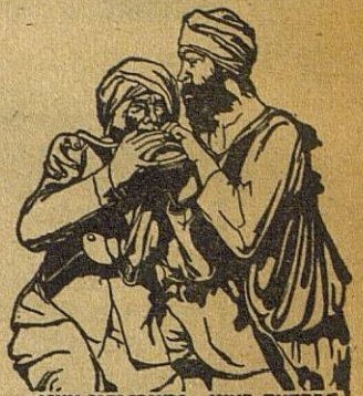
JOHN CLEMENTS - JUNE DUPREZ AUBREY SMITH - RALPH RICHARDSON