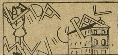
Al cobro el primer trimestre del Repartimiento

Vida Religiosa: En la Parroquia de Ntra. Sra. de la Asunción y Angeles se está celebrando la solemne y tradicional novena en honor del glorioso Patriarca San José.--La semana cinematográfica en nuestro Teatro Principal.-Otras noticias e informaciones