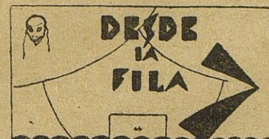
CINE.—«El hijo de Montecristo»

Recibirá a su distinguida clientela todos los miércoles, de 5 a 7, en Hotel Central de esta localidad.