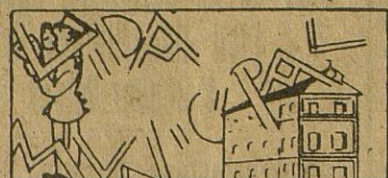
El padrón de las cartillas de beneficencia.

El próximo día 19 dará comienzo en la Parroquia de Santo Domingo, la solemne y tradicional novena en honor de Ntra. Sra. de la Medalla Milagrosa.—La Empresa Diaz reanudó el pasado lunes el magnífico servicio de autobús Cabra-Sevilla y viceversa.—En la Parroquia de la Asunción se celebraron solemnes funerales por el alma del Cardenal Parrado