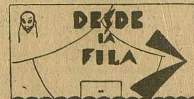
La semana cinematográfica en el Teatro Principal