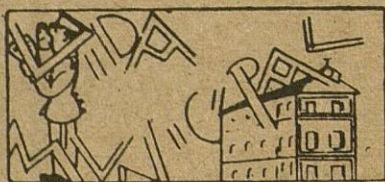
Al cobro el impuesto sobre alcantarillado