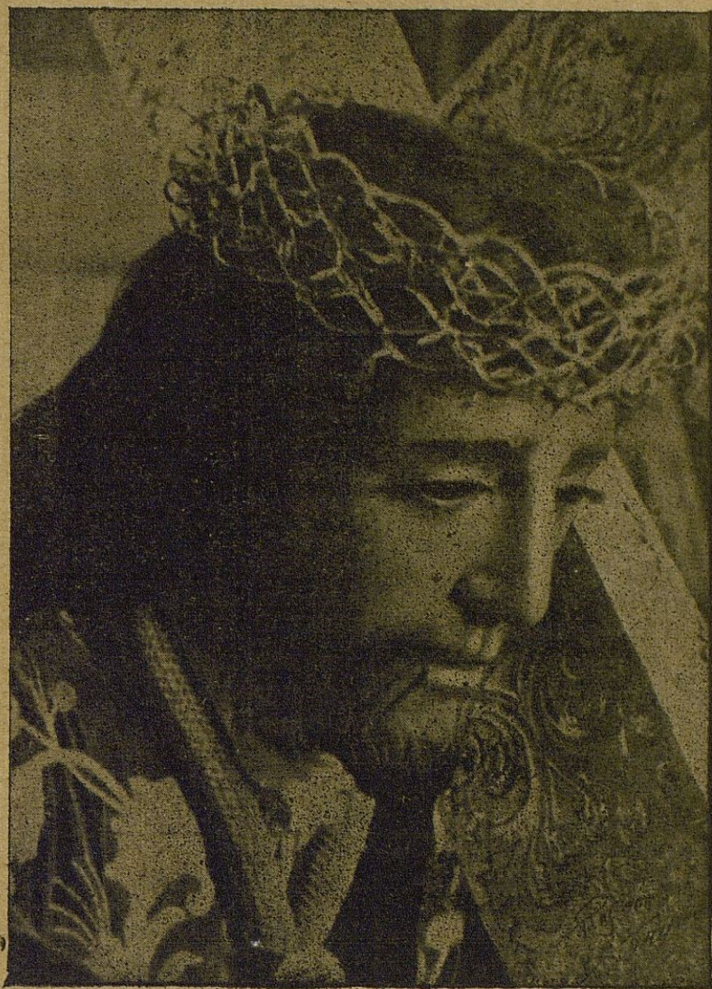
INTRO. PADRE JESÚS NAZARÉNO

Hasta nuestros días, llegaron ya desvaídos y difuminados estos autos populares nacidos del fervor y sentida devoción de nuestros antepasados: El Sacrificio de Abrahán, y el prendimiento de Cristo en la mañana del Viernes Santo, (escenas de ternura y emoción, explicadas por la autorizada voz de la Iglesia, en la histórica plaza Vieja, cara a las piedras seculares del Castillo de los Condes de